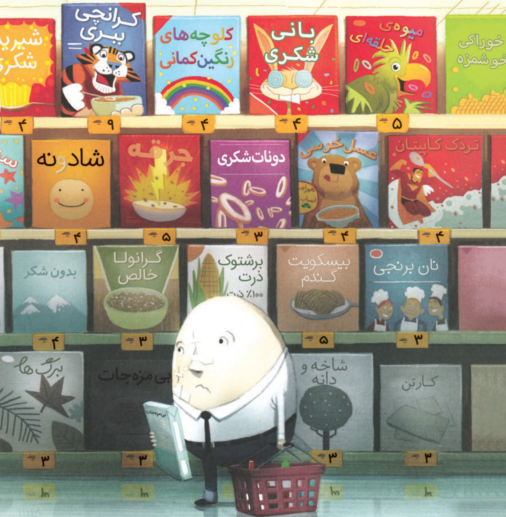
از آن روز به بعد، از ارتفاع می ترسیدم.